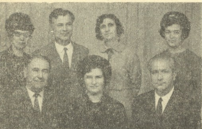
Музикално- теоретична група — 1970 г.