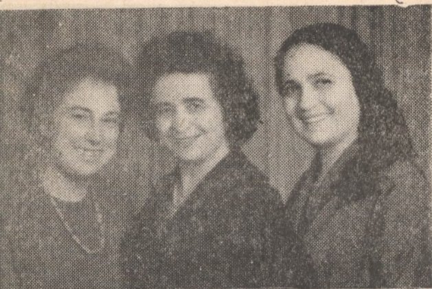
Вокална група 1970 г.