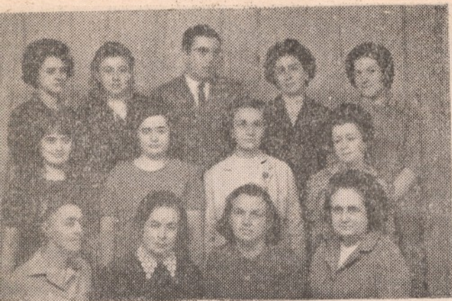
Клавирна група 1970 г.