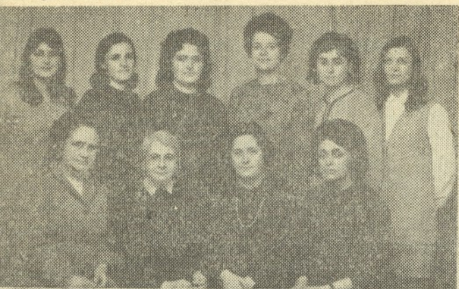
Групата по задължително- паяно — 1970 г.