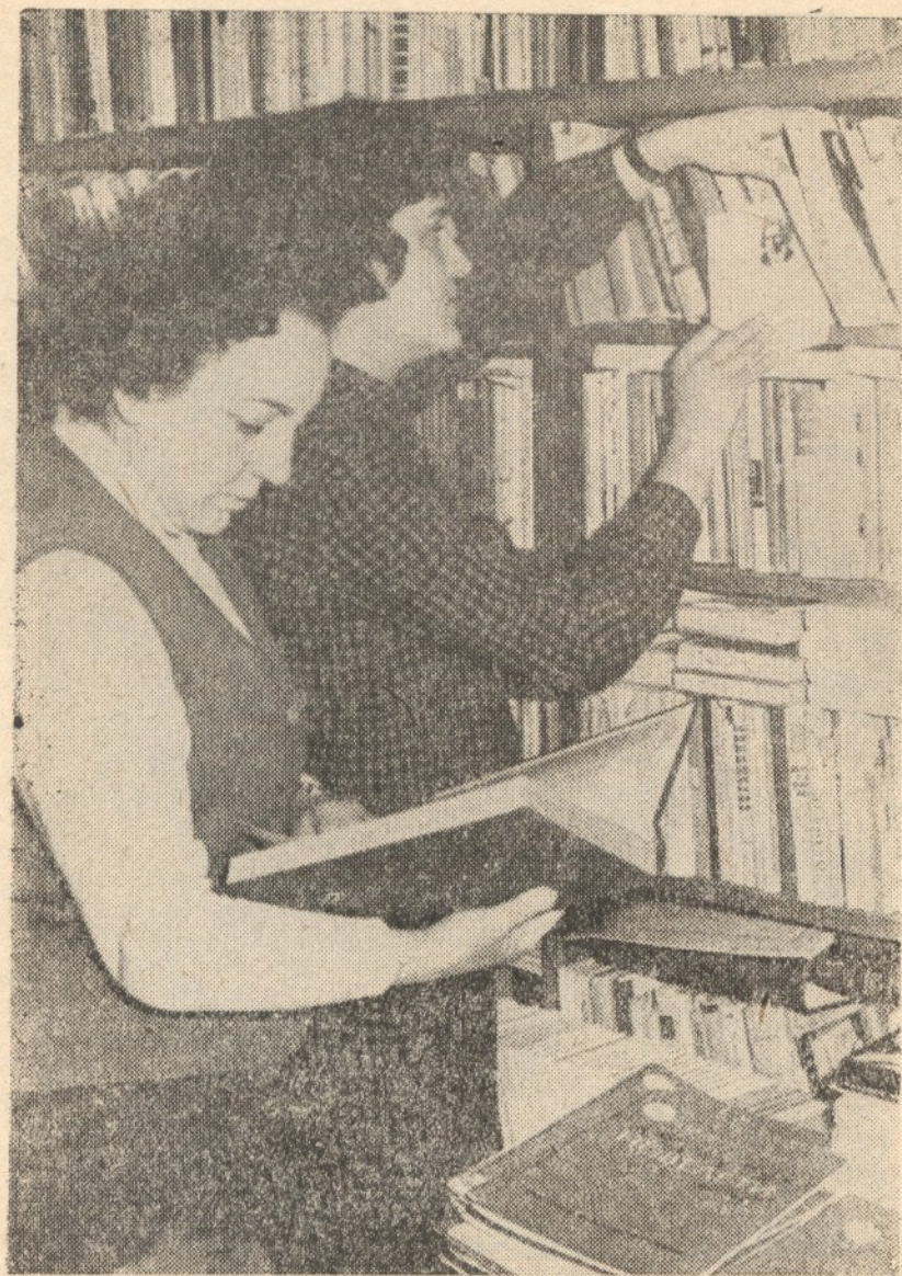
Библиотеката на училището 20 000 тома нотна, музикална, теоретична и учебна литература