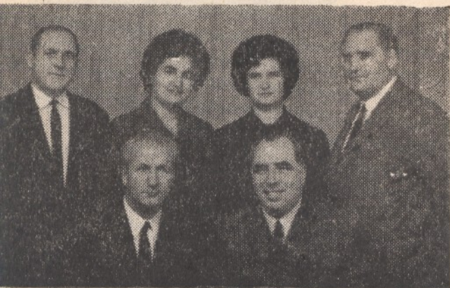
Партийна група — 1970 г.