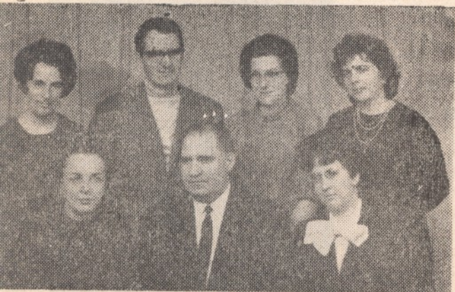
Съюзен комитет — 1970 г.