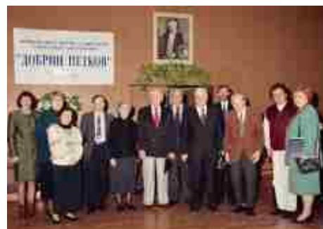
Национален конкурс с международно участие "Добрин Петков" за цигулари, създаден 1995 г.