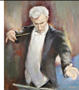
Добрин Петков (1923 – 1987) - портрет художник Александър Жибаров

"Изкуството съществува в живота на човека, за да събужда и разгаря искрата на най-благородното у него. Колкото по-голям кръг от хора бъдат засегнати от въздействието му, толкова по-пълноценно бива изпълнена неговата велика мисия. И затова всеки, чиято съдба е да бъде посредник между изкуство и хора, е толкова по-щастлив, колкото повече са тези, сред които сее зърната.