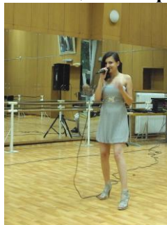
Поп и джаз пеене