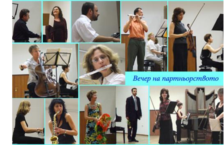
Вечер на партньорството