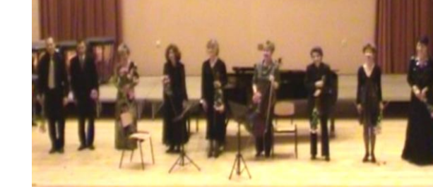
По случай 65-годишнината от основаването на училището Концерт на преподаватели, посветен на 200 години от рождението на Шуман, изнесен в НМУ ”Любомир Пипков” - София

Симфоничният оркестър при НУМТИ „Добрин Петков“ под диригентството на Негово превъзходителство Генералния консул на Република Гърция Никос Матюдакис с една от най-популярните и обичани творби в Европа – завладяващия и бравурен „Радецки марш“ от Йохан Щраус.